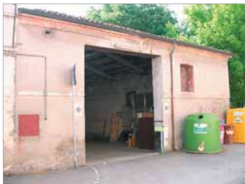
Via Cadorna 28 Fronte Principale